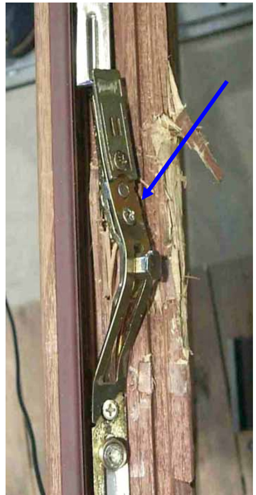
Bild 1 Beschlag aus dem Flügelprofil gezogen

Es gibt eine Vielzahl von Merkmalen, die bei der Serienfertigung von einbruchhemmenden Fassadenelementen berücksichtigt werden müssen, um den klassifizierten Widerstand der Prüfung im Labor zu erreichen. Im Folgenden sind einige Merkmale aufgeführt, die das verdeutlichen sollen.