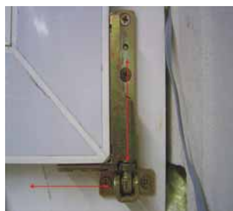
Bild 6 Verstellbares Scharnier