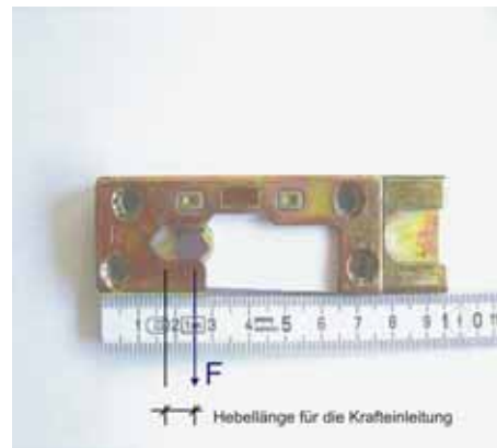
Bild 4 Ungünstiger Einschluss des Zapfens