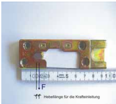
Bild 3 Optimaler Einschluss des Zapfens

Noch kritischer kann die Einbautoleranz sein, wenn der Pilzzapfen rund und die Einschlusstasche des Schließbleches kürzer ist, wie in folgenden Bildern dargestellt.