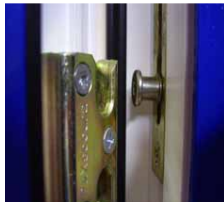
Bild 5 Runder Zapfen im mit Einschlussblech

Eine VdS-Anerkennung setzt immer eine Produktprüfung in der entsprechenden Widerstandsklasse und die anschließende Zertifizierung der Baureihe mit allen Größenvariationen und Optionen voraus. Bestandteil der Zertifizierung ist außerdem eine regelmäßige Produktüberwachung in der Fertigungsstätte. VdS-erkannte Produkte sind daher für einen sicherheitsbewussten Kunden die sicherere Wahl.